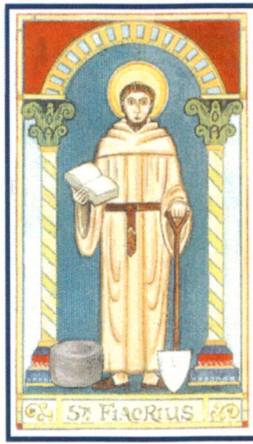
Schutzpatron der Koloproktologen